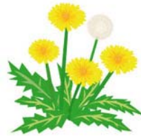
せいようたんぼぼ