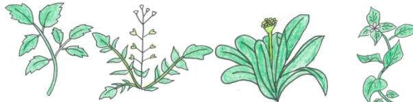
せり なずな ごぎょう はこべら (ぺんぺんぐさ) (ははこぐさ) (はこべ)