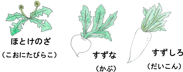
ほとけのざ すずな すずしろ (こおにたびらこ) (かぶ) (だいこん)